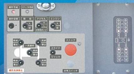
アウトリガ操作パネル(車両左側方・車両右側方)